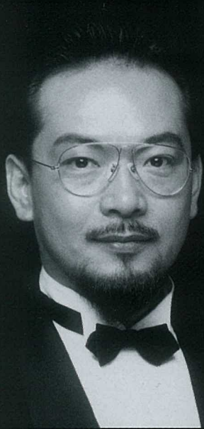
テノール 福井 敬

解禁直後のセントレアオリジナルボーショレウエイージュ 又「ウオーヤ」や「セントレア」で開催中の巨大アートキルト「源氏 物語千年紀」展作品(一部)をお楽しみいただけます。