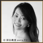
パミーナ 文屋 小百合