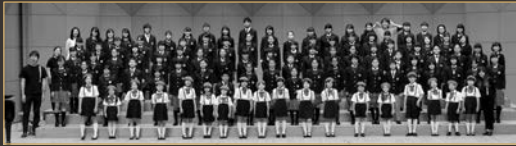
童子 シンフォニー・ヒルズ少年少女合唱団