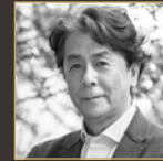
ナレーション 長谷川 初範