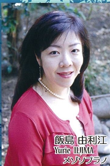
飯島 由利江 Yurie IIJIMA メゾソプラノ