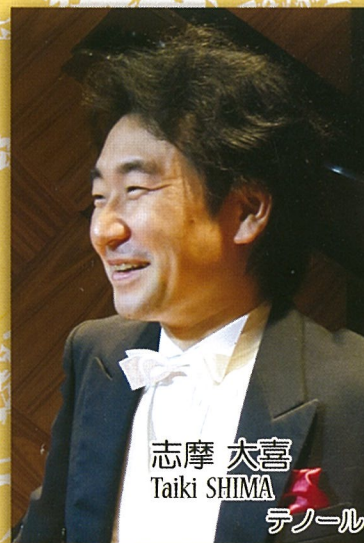
志摩 大喜 Taiki SHIMA テノール